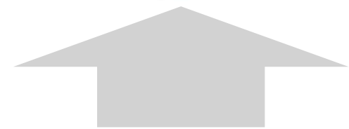
GRUNDRISS RECHTS 41/2 ZIWO NWF 114.55 Ost