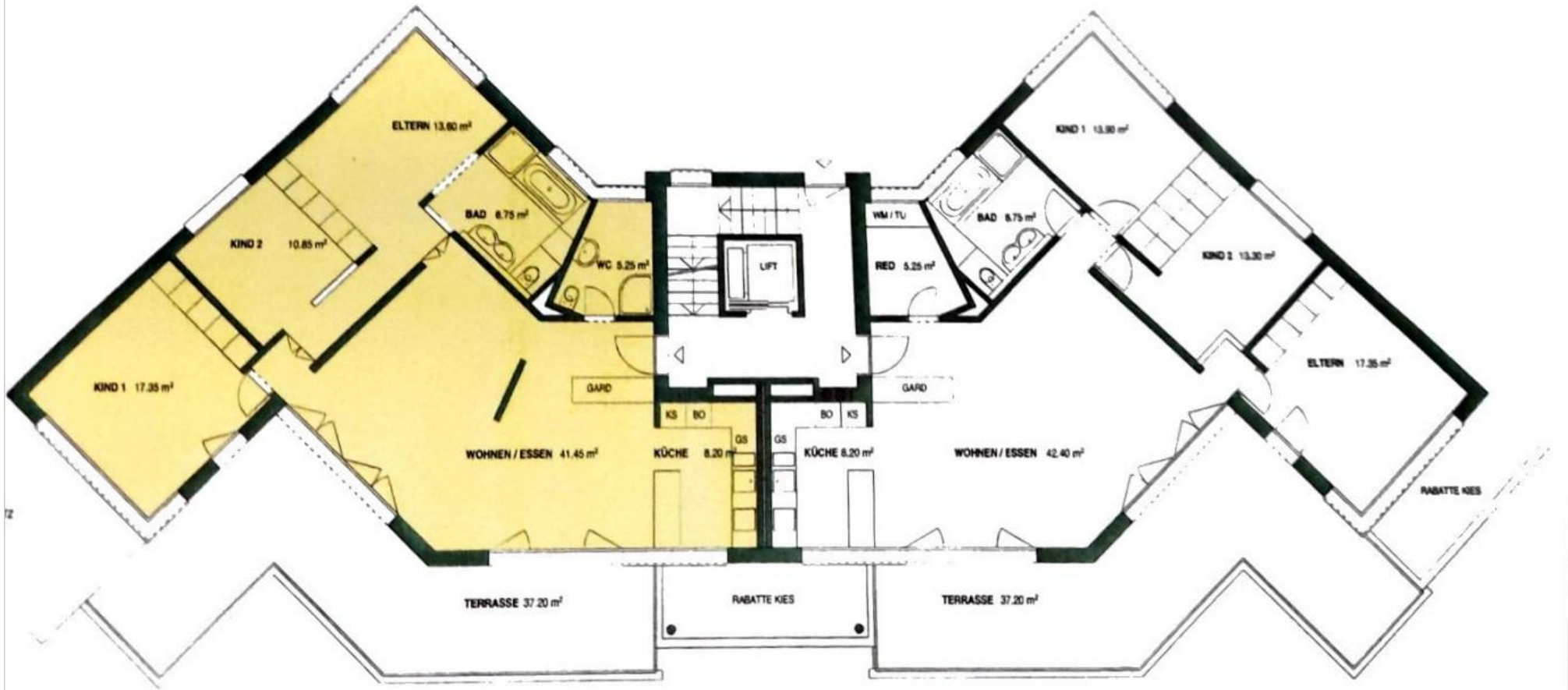
GRUNDRISS LINKS 41/2 ZIWO NWF 114.55M2 West